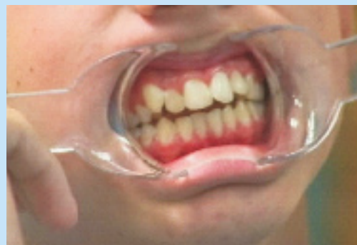
FIGURE 3: Menino com dezesseis anos de idade com mordida aberta anterior (B) e deglutição atípica (C). Hiperatividade do músculo orbicular da boca e do mentalis são percebidas quando é pedido ao paciente que feche os lábios (A).