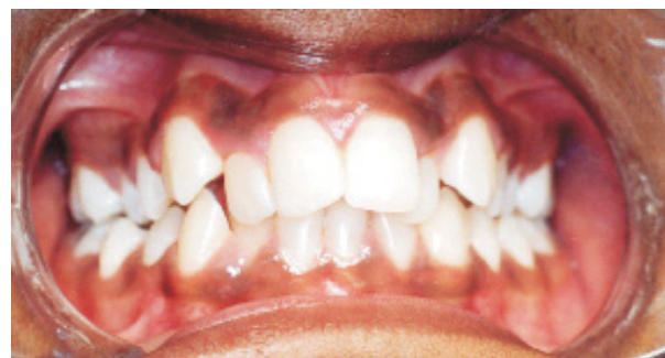
FIGURA 1: Menina de quinze anos de idade com disfunção de tecido mole associada à má-oclusão. Note a pouca largura e o formato triangular do arco superior (B) devido à hiperatividade dos músculos bucinadores aplicando altas forças sobre os dentes posteriores, com forças ainda maiores sobre a área dos caninos. A incompetência para o selamento labial colabora com o formato triangular e dentes apinhados (C), pois a força que deveria ser aplicada pelo lábio superior sobre o incisivo não está presente na paciente.