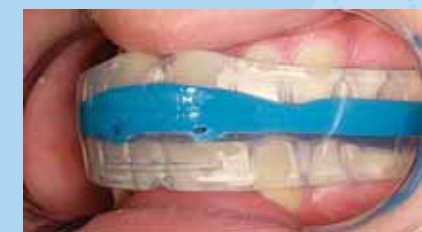
➤ VERIFICAR LA POSICION CORRECTA DE LOS CANINOS

Después de formular y colocar el aparato, es importante establecer revisiones rutinarias para asegurar que el tratamiento está evolucionando correctamente. Espere ver cambios dentales y del tejido blando en los primeros 2-3 meses. Controle al paciente cada 1-2 meses. Tome modelos y fotos en estas visitas para controlar el progreso del paciente y mantener un correcto expediente.