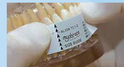
➤ MEDIR DEL INCISIVO SUPERIOR IZQUIERDO

El MYOBACE™ apropiado se selecciona midiendo los cuatro incisivos superiores. La medida se basa en el ancho de los anteriores superiores. Si hay espacios o apiñamiento, la dimensión no se altera pues la referencia es el diente, no su colocación.