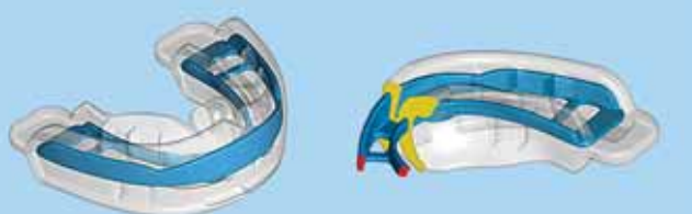
➤ VISTA EN PERSPECTIVA