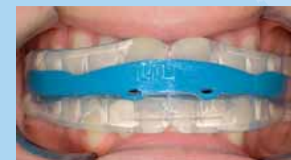
➤ VERIFICAR LA ALINEACION CORRECTA DE LOS CANALES DENTALES

Usar el MYOBACE™ por un mínimo de dos horas cada día y durante la noche, es todo lo que se requiere para proporcionar la expansión adecuada del arco y el alineamiento de la dentición anterior.