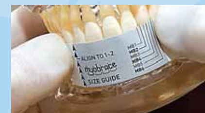
➤ AL INCISIVO SUPERIOR DERECHO

El aparato está disponible en seis tamaños individuales, que cubren la mayoría de casos. Cuando este puesto, compruebe que la posición de los caninos superiores corresponde con los canales dentales del MYOBACE™.